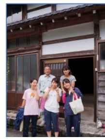
民泊は家族のような雰囲気