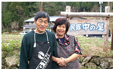
地域の話や聞いたら民宿！