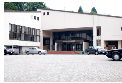
相部屋で手軽に泊まるなら利賀創造交流館