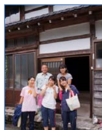
民泊は家族のような雰囲気