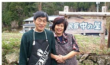
地域の話を聞いたら民宿!