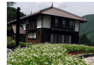
ネパール建築様式 暎水の館