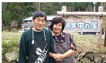
地域の話聞くなら民宿!