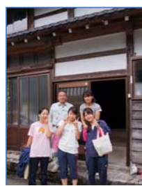
民泊は家族のような雰囲気